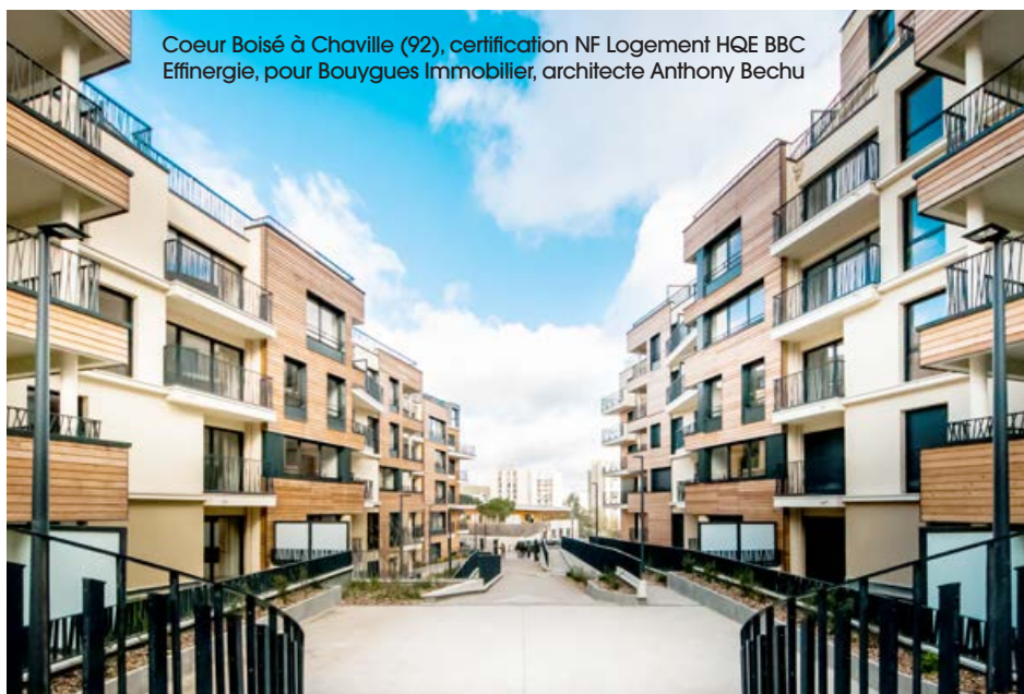
Coeur Boisé à Chaville (92), certification NF Logement HQE BBC Effinergie, pour Bouygues Immobilier, architecte Anthony Bechu

Cerqual a besoin que l'ACERMI poursuive son action de sérieux et de performance. Il serait intéressant qu'elle s'ouvre à la certification d'autres caractéristiques, comme le cycle de vie du produit dans le cadre de la réglementation des bâtiments bas carbone, par exemple, un élément de plus en plus prégnant sur les produits de construction.